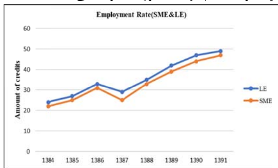
نمودار ۱۰. مقایسه اشتغال ایجاد شده در شرکت‌های بزرگ و کوچک و متوسط طی سال‌های (۱۳۸۴-۱۳۹۱)

همان‌طور که در نمودار (۱۰)، مشاهده می‌کنید. نرخ اشتغال‌زایی کل بنگاه‌ها (کوچک، متوسط و بزرگ) در بازه زمانی بین سال‌های (۱۳۸۴-۱۳۹۱)، با در نظر گرفتن کل اعتباراتی که از طرف دولت انجام گرفته به‌صورت صعودی می‌باشد.