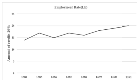
نمودار ۵. میزان اشتغال ایجاد شده در شرکت‌های بزرگ با در نظر گرفتن اعتبارات ۲۰ درصدی طی سال‌های (۱۳۸۴-۱۳۹۱)

رشد و توسعه کسب و کارها برای اشتغال‌زایی در صنایع مختلف بدون طراحی و اجرای استراتژی مناسب امکان‌پذیر نیست. کسب و کارهای کوچک و متوسط پدیده‌ای اقتصادی در سطح جهانی است که به‌عنوان الگویی مدرن برای توسعه اقتصادی مطرح شده است. از دیدگاه نظری، می‌توانند بخش‌های