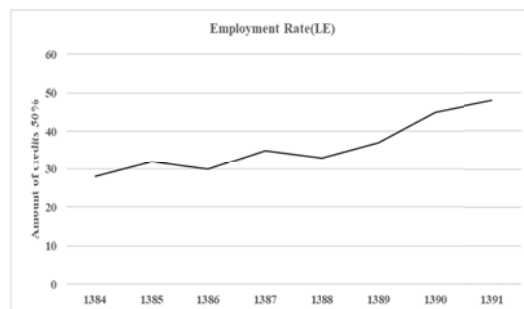
نمودار ۸. میزان اشتغال ایجاد شده در شرکت‌های بزرگ با در نظر گرفتن اعتبارات ۵۰ درصدی طی سال‌های (۱۳۸۴-۱۳۹۱)