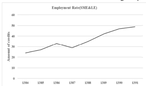
نمودار ۹. میزان کل اشتغال ایجاد شده در شرکت‌ها (کوچک، متوسط و بزرگ) طی سال‌های (۱۳۸۴-۱۳۹۱)

همان‌طور که در نمودار (۹)، مشاهده می‌کنید. نرخ اشتغال‌زایی کل در بازه زمانی بین سال‌های (۱۳۸۴-۱۳۹۱)، با در نظر گرفتن کل اعتباراتی که از طرف دولت انجام گرفته به‌صورت صعودی می‌باشد.