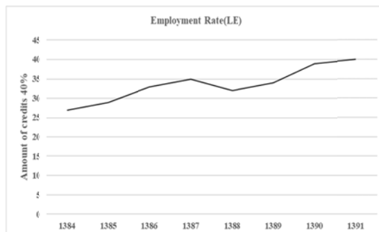
نمودار ۷. میزان اشتغال ایجاد شده در شرکت‌های بزرگ با در نظر گرفتن اعتبارات ۴۰ درصدی طی سال‌های (۱۳۸۴-۱۳۹۱)