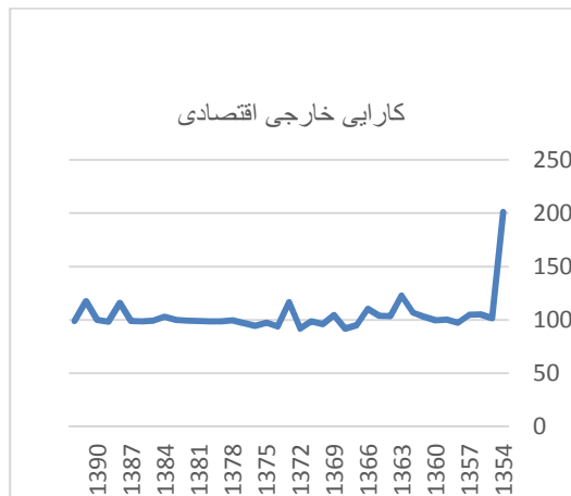
نمودار ۱. روند کارایی خارجی اقتصادی آموزش

کارایی سیستم را ارتقاء می‌بخشد. نتایج میزان کارایی خارجی در دو حوزه اقتصادی و اجتماعی و کلی در نمودارهای شماره ۱ تا ۳ آمده است.