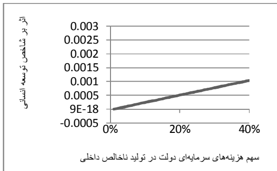
نمودار (۴): کشورهای در حال توسعه