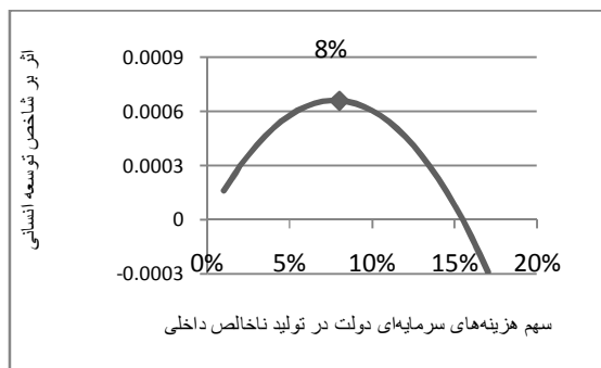
نمودار (۳): کشورهای توسعه یافته

با توجه به جدول (۲) مشاهده می‌کنیم که رابطه هزینه‌های سرمایه‌گذاری دولت با HDI در هر دو گروه کشورهای توسعه یافته و در حال توسعه مثبت و معنادار است و لذا هر واحد از این هزینه‌ها در کشورهای توسعه یافته اثر بیشتری بر HDI خواهد داشت.